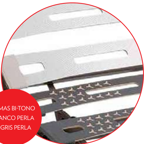
LAMAS BI-TONO BLANCO PERLA Y GRIS PERLA