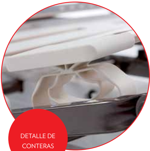
DETALLE DE CONTERAS