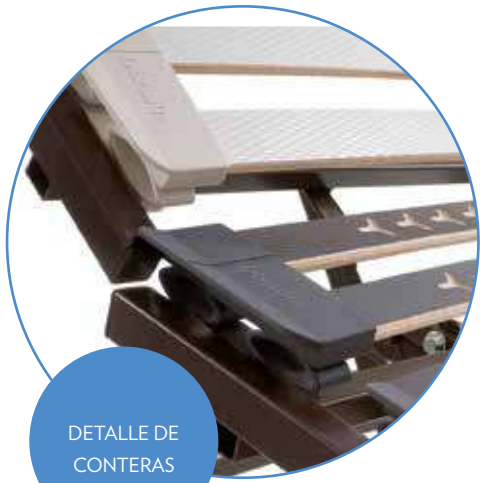
DETALLE DE CONTERAS